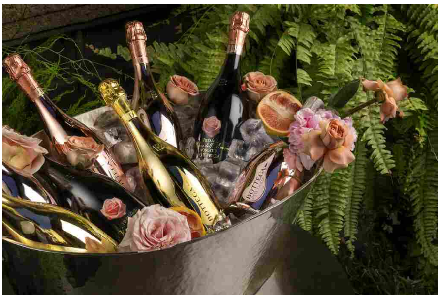
Particolari di bottiglie di Bottega Gold Prosecco Doc

“Sono orgoglioso di iniziare una collaborazione con un gruppo di ospitalità così prestigioso come Atmosphere Core. Il nostro obiettivo principale è portare la cultura enologica italiana in Asia meridionale. Le Maldive sono una destinazione di lusso, che abbraccia gli stessi valori di qualità ed eleganza del nostro prodotto di punta”: Bottega GOLD Prosecco DOC. Inoltre, speriamo di introdurre anche i nostri Bottega O Rosé e White, entrambi senza alcol. Entrambi analcolici offrono la stessa ritualità di consumo degli spumanti, nel rispetto degli astemi e di tutti coloro che, per qualsiasi motivo, scelgono di essere prudenti nel consumo di alcol. Sono infine entusiasta dell’opportunità di aprire un Prosecco Bar, che rappresenterà una sorta di ambasciata della cucina italiana nelle isole”.