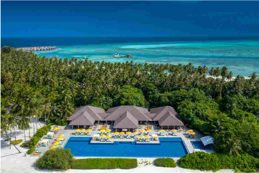
Atmosphere Kanifushi Maldives