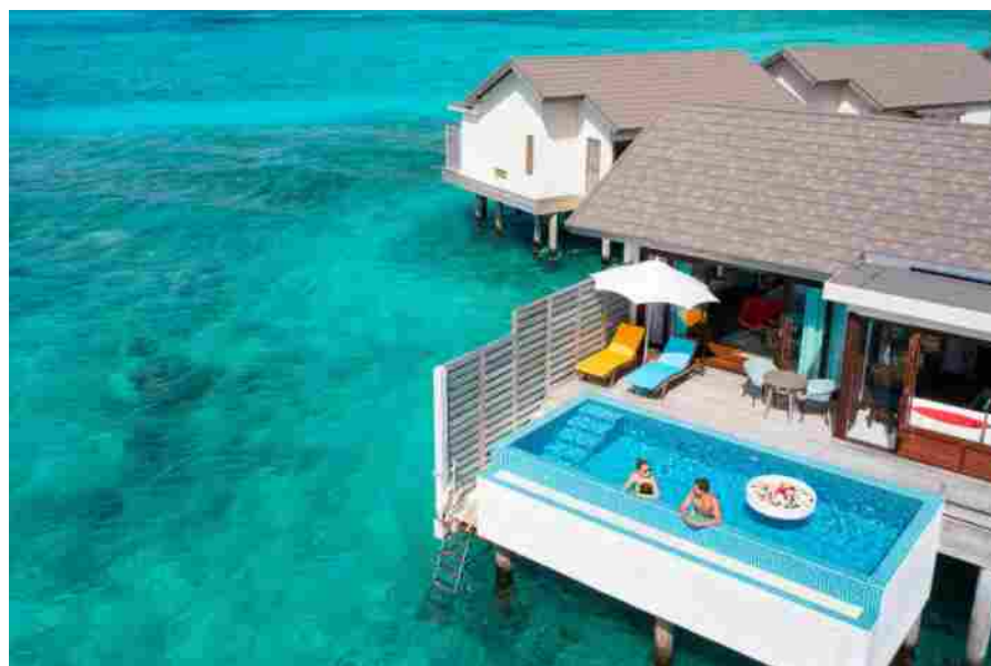
Atmosphere Kanifushi Maldives

La proposta di vini di Atmosphere Core si arricchisce con la quinta partnership siglata con l'icona mondiale del Prosecco